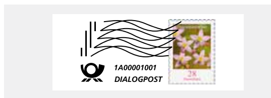
Muster bei Verwendung digitaler Drucksysteme In Schwarz, ohne Datum, mit individueller Seriennummer

Keine passenden Postwertzeichen? Die Differenzbeträge ersetzen wir Ihnen bis zum nächsthöheren Postwertzeichen.