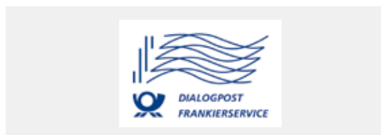
Muster für Stempelabdruck DIALOGPOST Nicht in Originalgröße

Mehr Infos erhalten Sie im Internet unter www.frankierservice.de