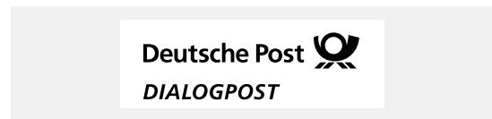
Muster für einen verkürzten Frankiervermerk

Die Frankierzone ist in diesem Fall von alphanumerischen Angaben freizuhalten, darf jedoch farbig bedruckt werden. Für die Frankierung von DIALOGPOST ohne Umhüllung ist der verkürzte Frankiervermerk daher besonders geeignet.