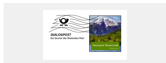
Muster kundenindividuelle Darstellung DIALOGPOST