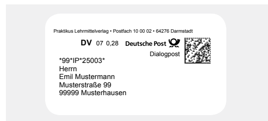
Muster für DV-Freimachung mit Datamatrixcode im Fenster

Bei der Verwendung einer zugelassenen Frankiermaschine (Freistempelabdruck Frankiermaschine oder FRANKIT) oder der Teilnahme am DV-Freimachungsverfahren (nach Vereinbarung mit der Deutschen Post) wird die Sendungsart DIALOGPOST in der Aufschrift benannt.