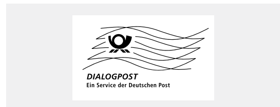
Muster Frankierwelle DIALOGPOST